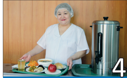
ПРИГОТОВЛЕНО С ЛЮБОВЬЮ