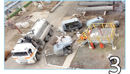
3 ТЕКУЩИЙ РЕМОНТ: В СРОК И КАЧЕСТВЕННО