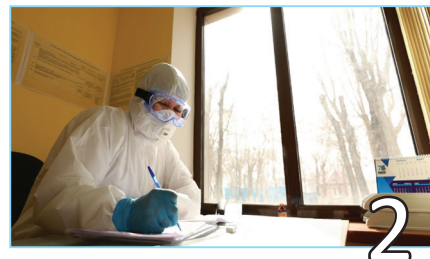
2 АҚ ХАЛАТТЫЛАР 24 САҒАТТЫҚ РЕЖИМГЕ КӨШТІ