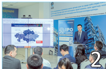
ЗАУЫТТЫҚТАР IPO БАҒДАРЛАМАСЫНА ҚАТЫСУ МҮМКІНДІКТЕРІМЕН ТАНЫСТЫ