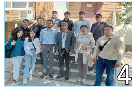
БІЛІКТІ МАМАН – ҚОҒАМ СҰРАНЫСЫ