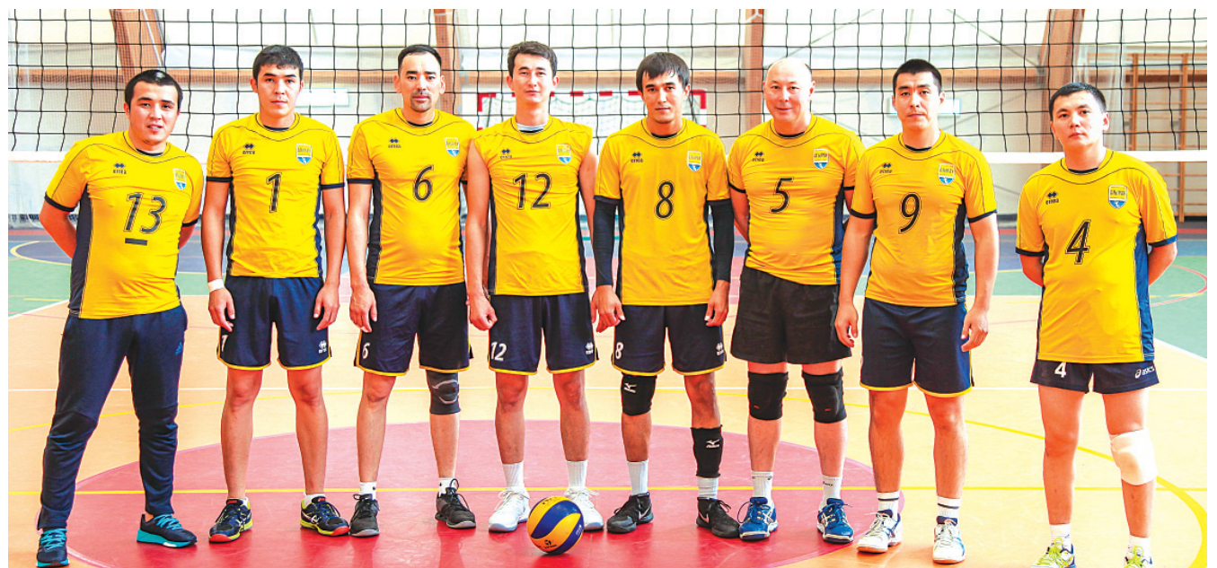
Волейбол. Мужчины. 3 место