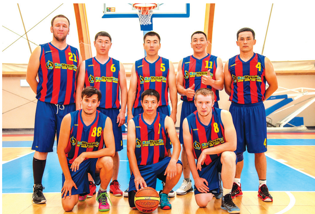
Баскетбол. 1 место