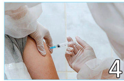
ЕКПЕ АЛУ – ЕРКІН ӨМІРГЕ ҚАДАМ