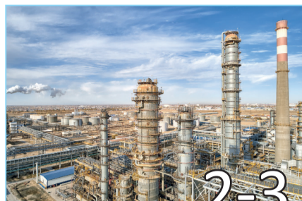
ДОРОЖНАЯ КАРТА ПО ИТОГАМ ВСТРЕЧ С ТРУДОВЫМ КОЛЛЕКТИВОМ ТОО «АНПЗ»