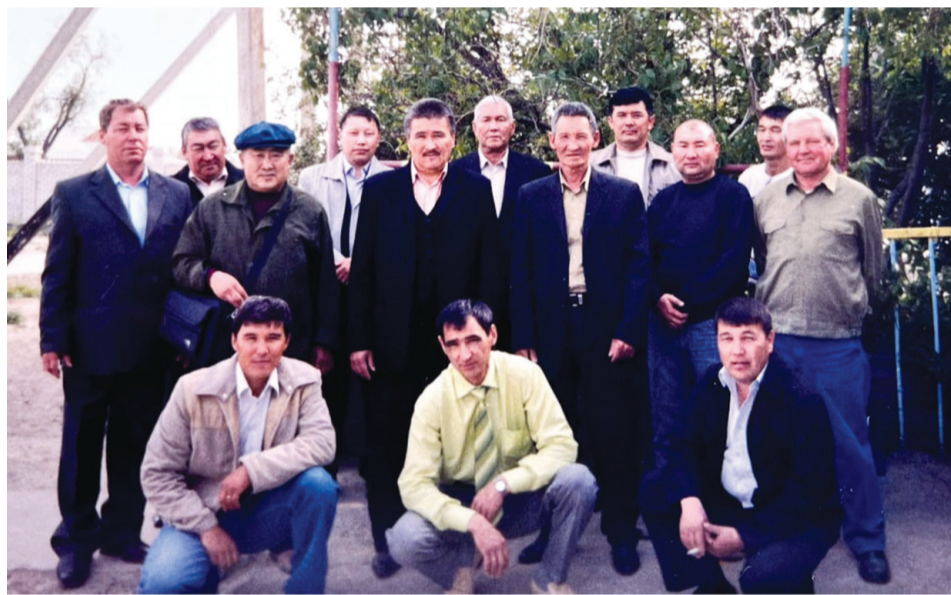
Фото с пенсионерами водозабора.

бежный артезианский насос производительностью 1 200 кубических метров воды в час. Есть еще 5 насосов – они в резерве. На промышленную площадку АНПЗ вода подается через выкидной коллектор по магистральному подземному водоводу, из которого есть выходы для полива зеленых насаждений в Жилгородке.