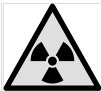
Интернациональный знак радиоактивности — элемент системы.

- лица, ответственные за радиационную безопасность и радиационный контроль на радиационных объектах; дозиметристы; лица, занятые работой по размещению генерирующих источников ионизирующего излучения,