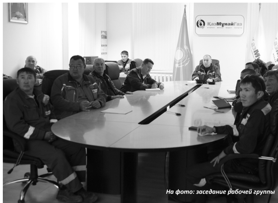
На фото: заседание рабочей группы