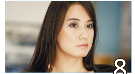
КРАСА ЗАВОДА - 2018