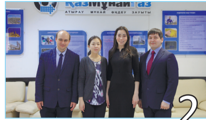
ЭФФЕКТИВНАЯ СИСТЕМА ПЛАНИРОВАНИЯ