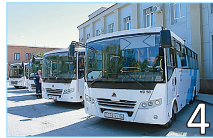
МЫ ЗА БЕЗОПАСНОСТЬ НА ДОРОГЕ