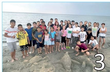
ЗАУЫТ БАЛАЛАРЫНЫҢ ЖАЗҒЫ ДЕМАЛЫСЫ ҚАЛАЙ ӨТТІ?