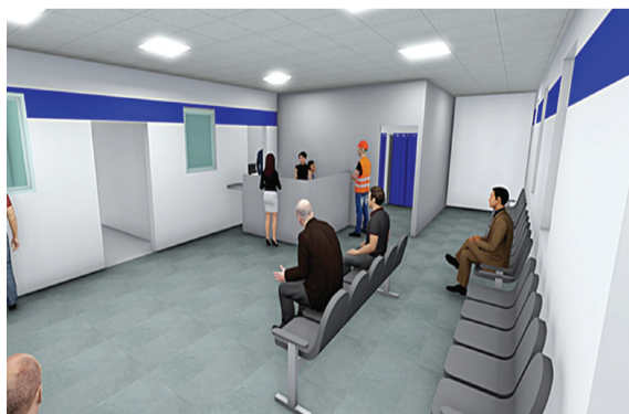
На фото: кабинет выдачи спецодежды до и после

Процесс обеспечения спецодежды и обуви (СИЗ) переводится на совершенно новую - сервисную модель. Все этапы поступления одежды и обуви на центральный склад, ее выдачи работникам, стирки, химчистки, подгонки и утилизации будут цифровизированы: каждый комплект будет чипирован по принадлежности работнику. В рамках проекта будут организованы складские помещения и комнаты для примерки и индивидуальной подгонки размера одежды, для сдачи ее в химчистку и мелкий ремонт. Таким образом, работники будут оперативно обеспечиваться необходимыми СИЗ для безопасных условий труда.