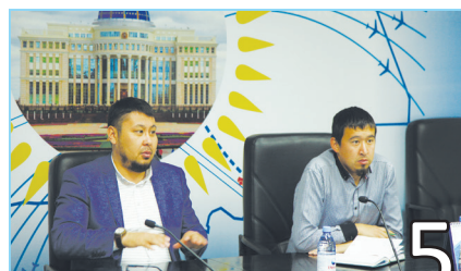
ИСЛАМ – БЕЙБІТШІЛІК ДІНІ