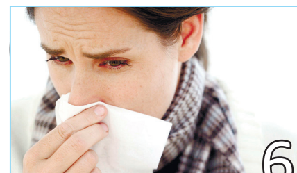
ГРИПП ИЛИ ОРВИ?