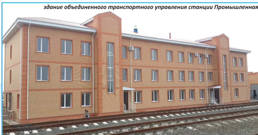
здание объединенного транспортного управления станции Промышленная

Завершение комплекса строительно-монтажных и пусконаладочных работ планируется в конце июня. Ввод объекта по Акту приемки в эксплуатацию запланирован на август-сентябрь текущего года.