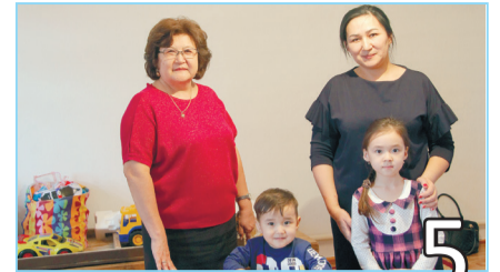
БАЛАЛАРҒА ҚУАНЫШ СЫЙЛАДЫ