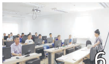
ОБУЧЕНИЕ ПЕРСОНАЛА КГПН