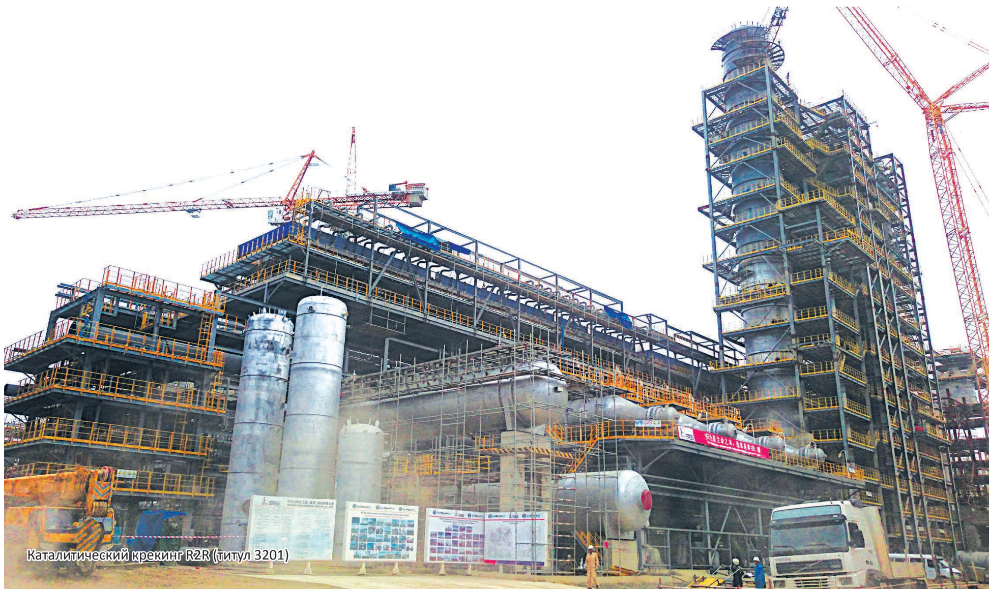
Каталитический крекинг R2R (титул 3201)

На строительной площадке комплекса глубокой переработки нефти на Атырауском НПЗ продолжается активная работа по бетонированию, монтажу инженерных сетей, технологических трубопроводов и крупногабаритного оборудования на объектах КФ «Sinopec Engineering (Group) Co. LTD».