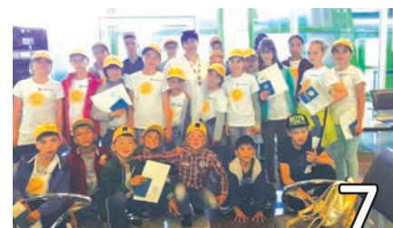
ОТДЫХ В СОСНОВОМ БОРУ