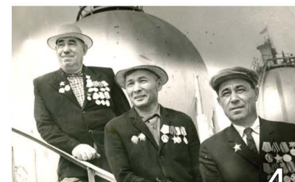
ОТВАЖНЫЙ АРТИЛЛЕРИСТ, ДОШЕДШИЙ ДО БЕРЛИНА