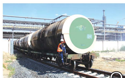
ЖАНА АЙНАЛМА ТЕМІРЖОЛЫ ПАЙДАЛАНЫЛУҒА БЕРІЛДІ