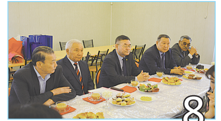
8 ДИАЛОГ С ЧИТАТЕЛЕМ