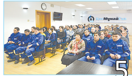
5 САЙЛАУШЫ ҚҰҚЫҒЫ МЕН ТАҢДАУ ЕРКІ