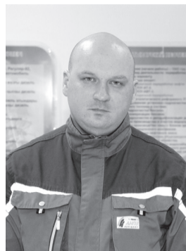
Почетной грамотой и