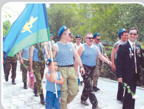
КЕҢЕС ӘСКЕРІНІҢ АУҒАНСТАННАН ШЫҒАРЫЛҒАНЫНА 25 ЖЫЛ