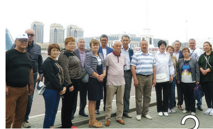
ЭСЕРГЕ БӨЛЕГЕН ҮШ КҮН