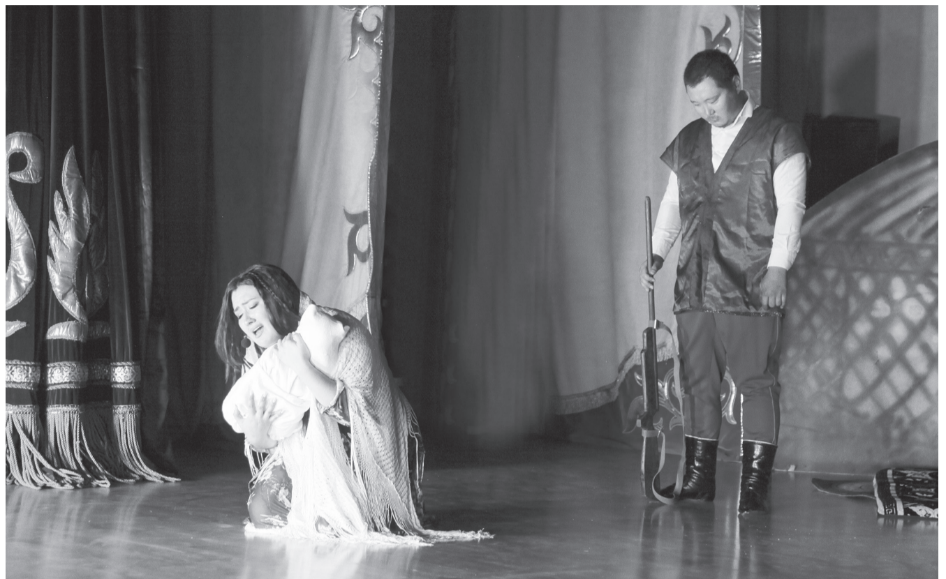
«РАЗГОВОРНЫЙ ЖАНР». 1 место - ПИТН