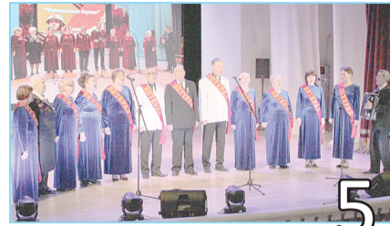
5 АРДАГЕРЛЕР ХОРЫНЫҢ ЕСЕПТІК КОНЦЕРТІ