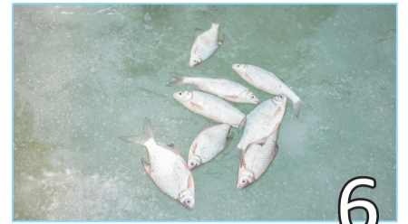
6 ЛОВИСЬ, РЫБКА...

Мерекелеріңізбен, асыл жандар! С праздником, дорогие женщины!