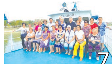
7 АҚ ЖАЙЫҚ БОЙЫНДАҒЫ ҒАЖАЙЫП САЯХАТ