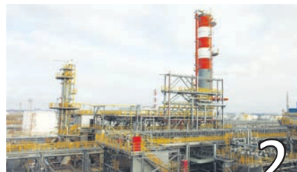
2 ПЕРЕСЫПКА АДСОРБЕНТОВ НА СЕКЦИИ ИЗОМЕРИЗАЦИИ КУ ГБД