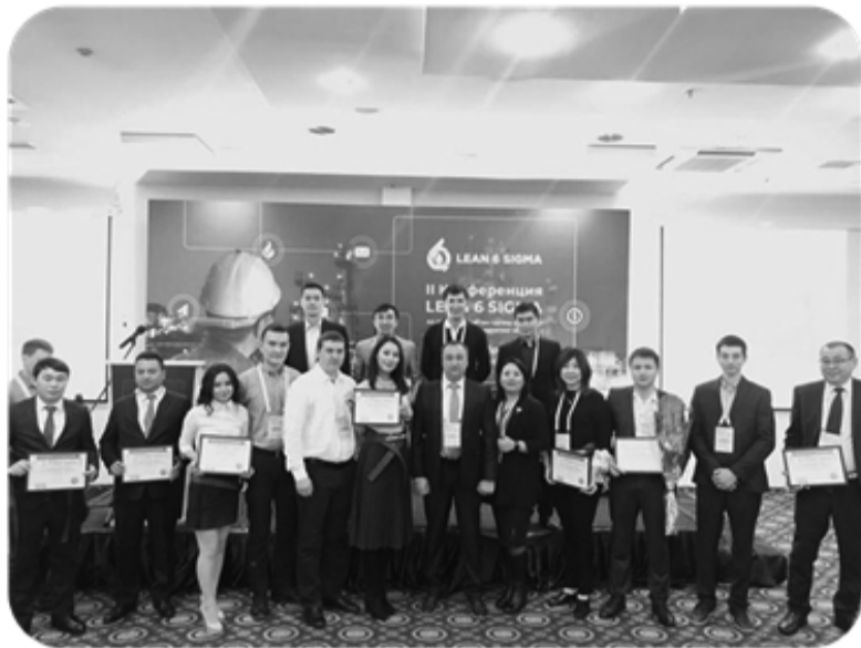
II Конференция. Вручение сертификатов в НК КМГ