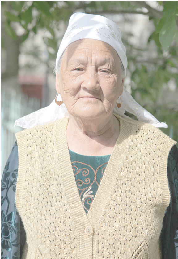
Осынау жылдар ішінде қатарластарыммен түрлі мерекелерде, арнайы шараларда жиі кездесіп тұрамын. Концерттер, қойылымдарға билет алып

- Өзім мына Индер ауданындағы Бөдене ауылының тумасымын. Бала кезімізден мал бағып өстік. Қара жұмысты ауырсынбайтынбыз. Қалаға келгенім 1968 жыл еді. Содан осы мұнай өңдеу зауытына бардым. 21 жаста болатынмын. Зауытта ол кезде соғыс ардагерлері көп. Алдымен, №6 цехта жұмыс істедім. Тазалықшы болдым. Ұжым мені өз қатарларына жылы қабылдады. Бәріміз бір үйдің адамдарындай араластық. Осы цехта 10 жыл жұмыс істедім. Одан соң зейнеткерлікке шыққанша №2 цехта болдым. 1988 жылы көп балалы ана ретінде жеңілдікпен зейнетке шығарды. Дегенмен, жұмысты жалғастыруға мүмкіндік болды. Содан 1995 жылға дейін зауытта еңбек еттім. Міне 20 жылдан асты зейнетке шыққаным. Ардагерлер Кеңесіне ризашылығым шексіз.