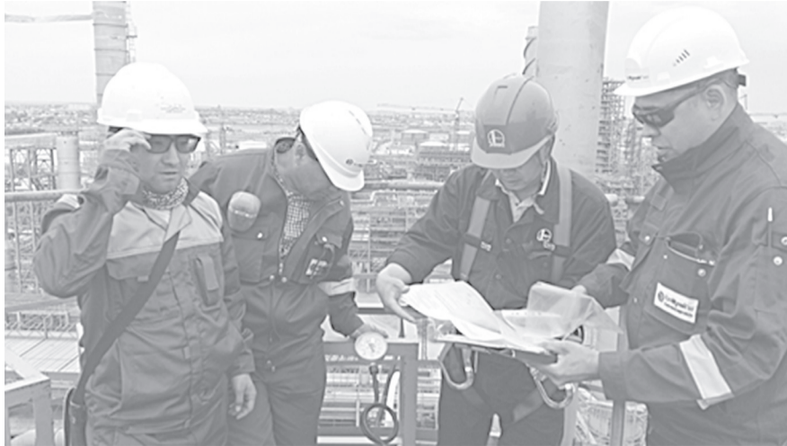
Гидравлическое испытание колонны С-1303 (тит. 3211)

После получения от КФ «Sinoprec Engineering (Group) Co. LTD» технических паспортов казахстанского образца на сосуды, работающие под давлением, специалистами производства КГПН и отдела технического надзора завода планируется проведение работ по их регистрации, которая продолжится до механического заверше-