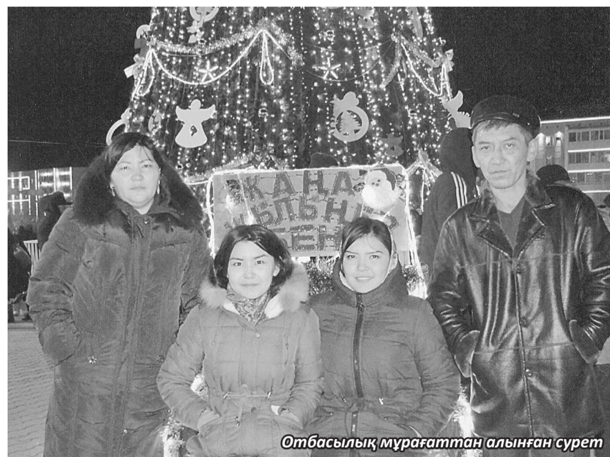
Отбасылық мұрағаттан алынған сурет

«Зауыттағы шаруашылық жұмыстардың барлығын атқарамын. Себебі, өзіме қатты ұнайды. Қағаз-қаламмен жұмыс жасау ойыма кіріп те шықпайды. Қолымның икемі шаруашылық жұмыстарға ұмтылып тұрғандай. Бала кезімнен өмірім зауытпен байланысты. Қиыншылығын да қуанышын да бірге көріп келемін. Зауыт менің екінші үйім.