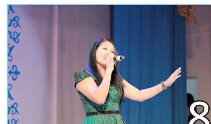
ЗАУЫТ СҰЛУЫ – 2018