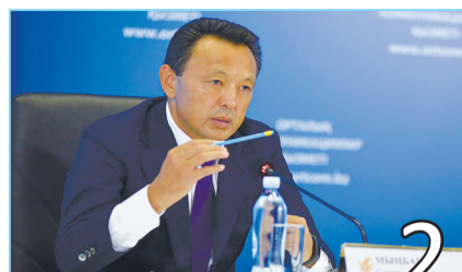
САУАТ МЫНБАЕВ: НЕФТЕХИМИЯ – НОВАЯ ВОЗМОЖНОСТЬ ДЛЯ КМГ