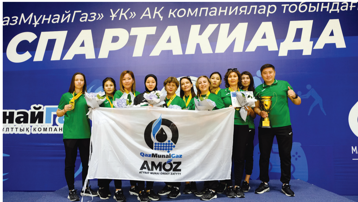
АМӨЗ волейболдан әйелдер командасы – I орын