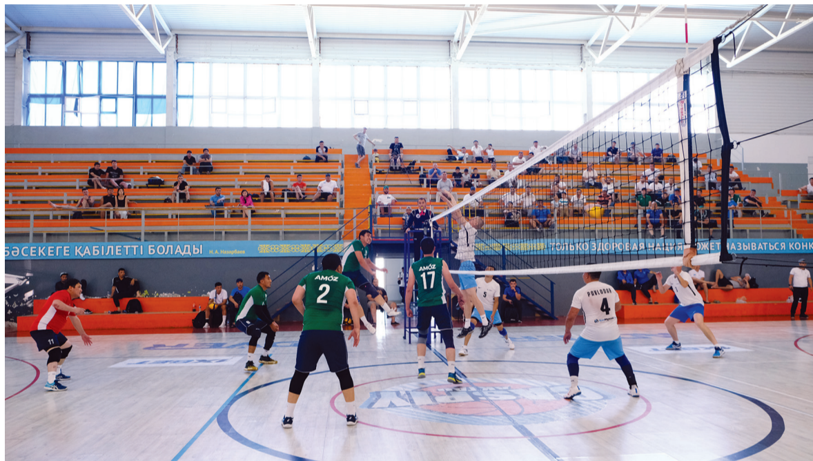
АМӨЗ волейболдан ерлер командасы – III орын

Армрестлинг, тоғызқұмалақ, үстел теннисі, мини-футбол спорттарына қатысқан зауыттықтарға бұл жолы жүлделі орын алу мүмкін болмады. Алдағы уақытта аталған спорт түрлеріне қатысқан спортшылар жүйелі түрде шынығып, келесі жолы жеңіске жетеді деген ойдамыз. Ал спартакиада жеңімпаздарын жеңістерімен құттықтай отырып, алар асуларыңыз көп болсын деген тілек білдіреміз.