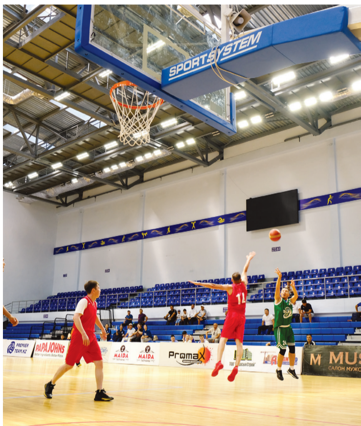
АМӨЗ баскетбол командасы – II орын

10-14 шілде аралығында «ҚазМұнайГаз» ҰК АҚ еншілес және тәуелді ұйымдар арасында спартакиада өтті. Спартакиада «Маңғыстаумұнайгаз» кәсіпорнының 60 жылдық мерейтойына арналды. Додаға 500-ге жуық қызметкер қатысты. Атырау мұнай өңдеу зауытынан келгендер спорттың 8 түрінен бәсекеге түсті.