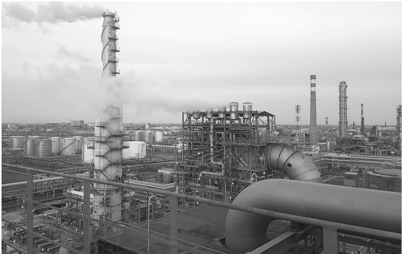
На фото: выход горячего воздуха из скруббера дымовых газов и пара с котла-утилизатора при проведении сушки футеровки

В связи с тем, что при нагреве происходит температурное расширение металла, это позволяет усилить монтажные соединения методом посто-