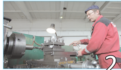
ТАПСЫРЫСТЫ МЕРЗІМІНДЕ ОРЫНДАУ ПАРЫЗ