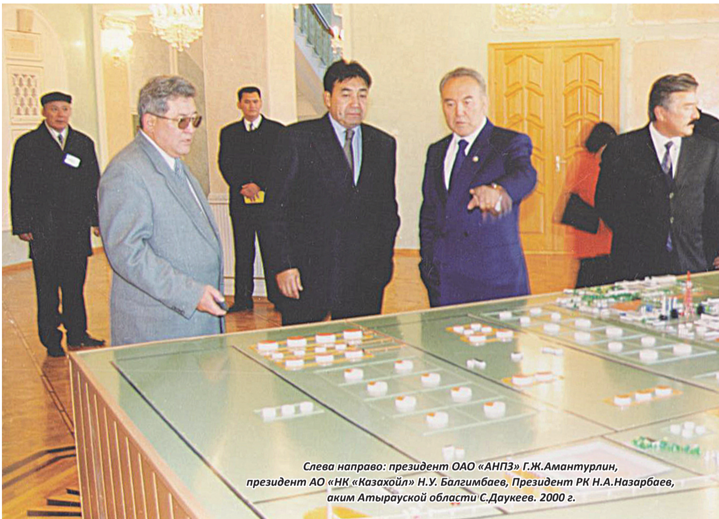
Слева направо: президент ОАО «АНПЗ» Г.Ж.Амантурлин, президент АО «НК «Казахойл» Н.У. Балгимбаев, Президент РК Н.А.Назарбаев, аким Атырауской области С.Даукеев. 2000 г.