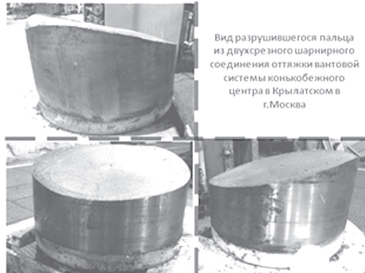
Вид разрушившегося пальца из двухсрезного шарнирного соединения оттяжки вантовой системы конькобегового центра в Крылатском в г.Москва