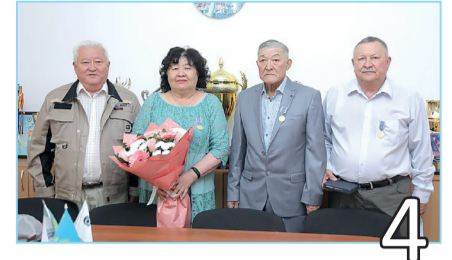
КӘСІПОДАҚ МАРАПАТЫ ТАБЫСТАЛДЫ