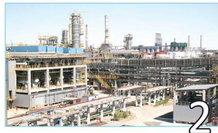
КАК НЕ ДОПУСТИТЬ КОРРОЗИИ?