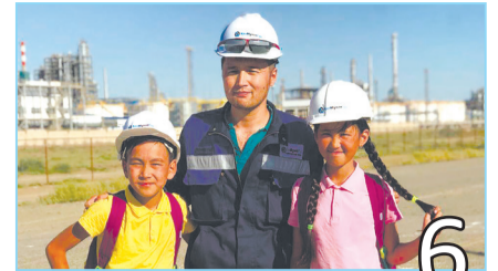
«БАЛАПАН» ТЕЛЕАРНАСЫ ҚОНАҚТА