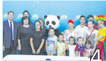
РАБОТНИКИ АНПЗ ПОМОГЛИ ШКОЛЬНИКАМ