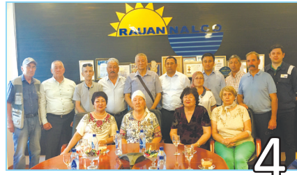
ЭККУРСИЯ В «РАУАННАЛКО»