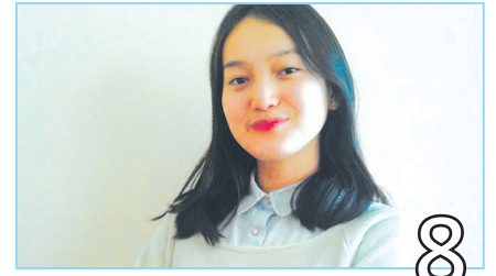
ЗАУЫТ СҰЛУЫ – 2018