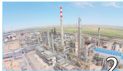
ИТОГИ ПРОИЗВОДСТВА ЗА МАРТ И I КВАРТАЛ 2017 ГОДА