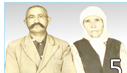
ОНИ ТРУДИЛИСЬ НА ЗАВОДЕ № 441