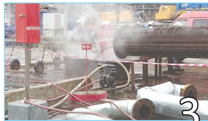
ПРОВЕДЕНЬ ПРОФИЛАКТИЧЕСКИЕ МЕРОПРИЯТИЯ