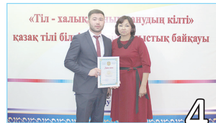
САЙЫСТЫҢ ЖҮЛДЕГЕРІ АТАНДЫ