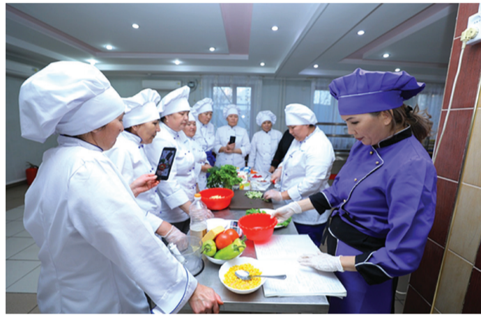
3. Проводятся мастер-классы для поваров заводских столовых.