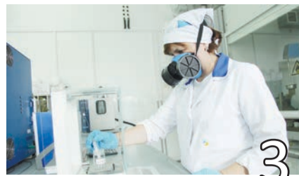
БЕНЗОЛ ГОТОВ К ОТГРУЗКЕ