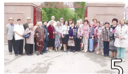
ЭКСПУРСИЯ ДЛЯ ВЕТЕРАНОВ